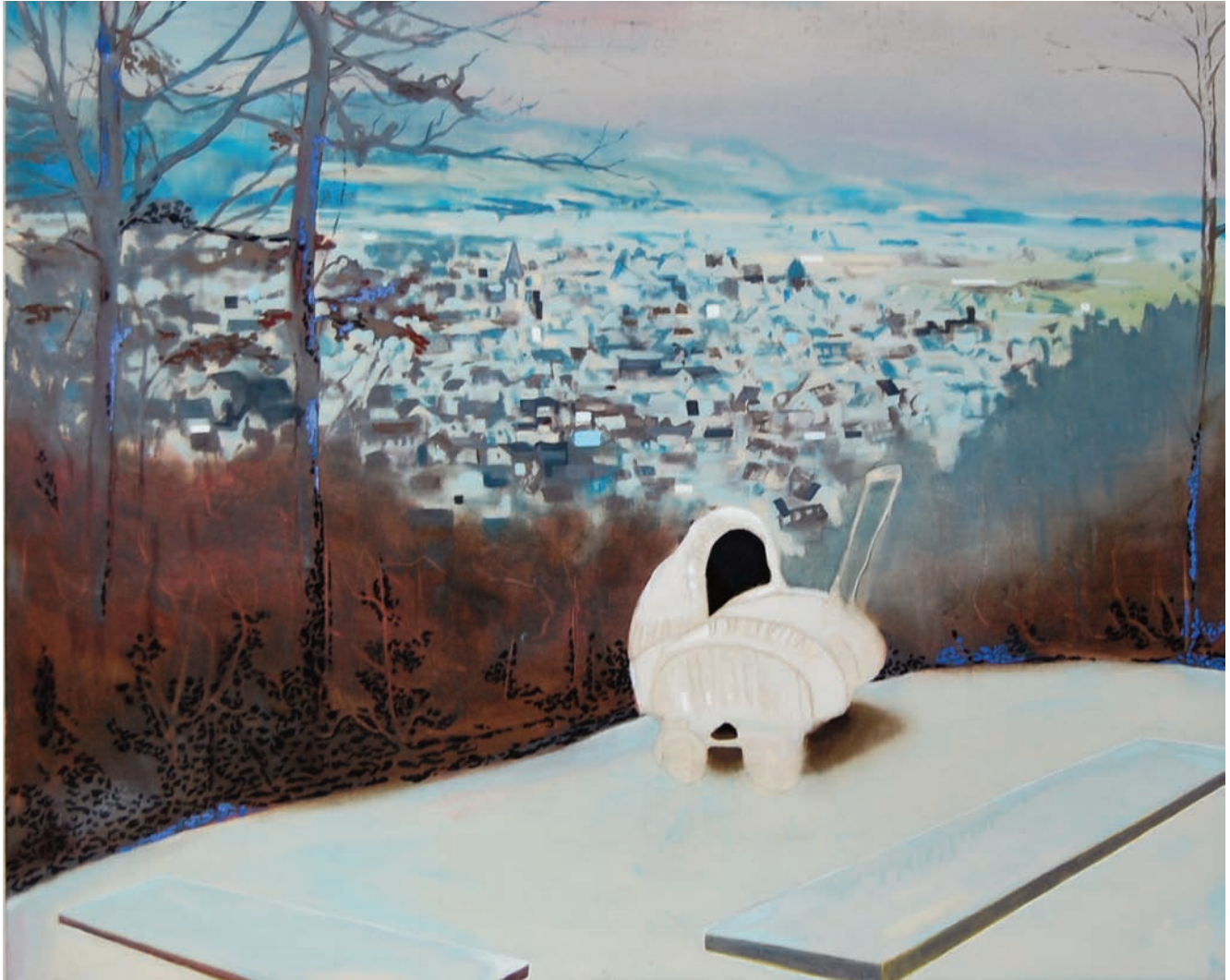
„Eine schwäbische Kindheit“ 2009/10, 80 x 100 cm, Öl und Acryl auf Leinwand