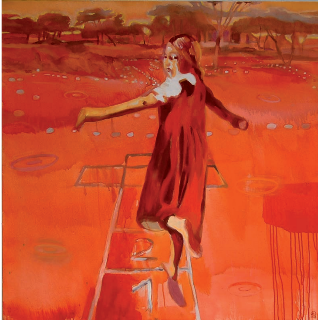
„Himmel und Hölle“ 2009, 100 x 100 cm, Öl und Acryl auf Leinwand