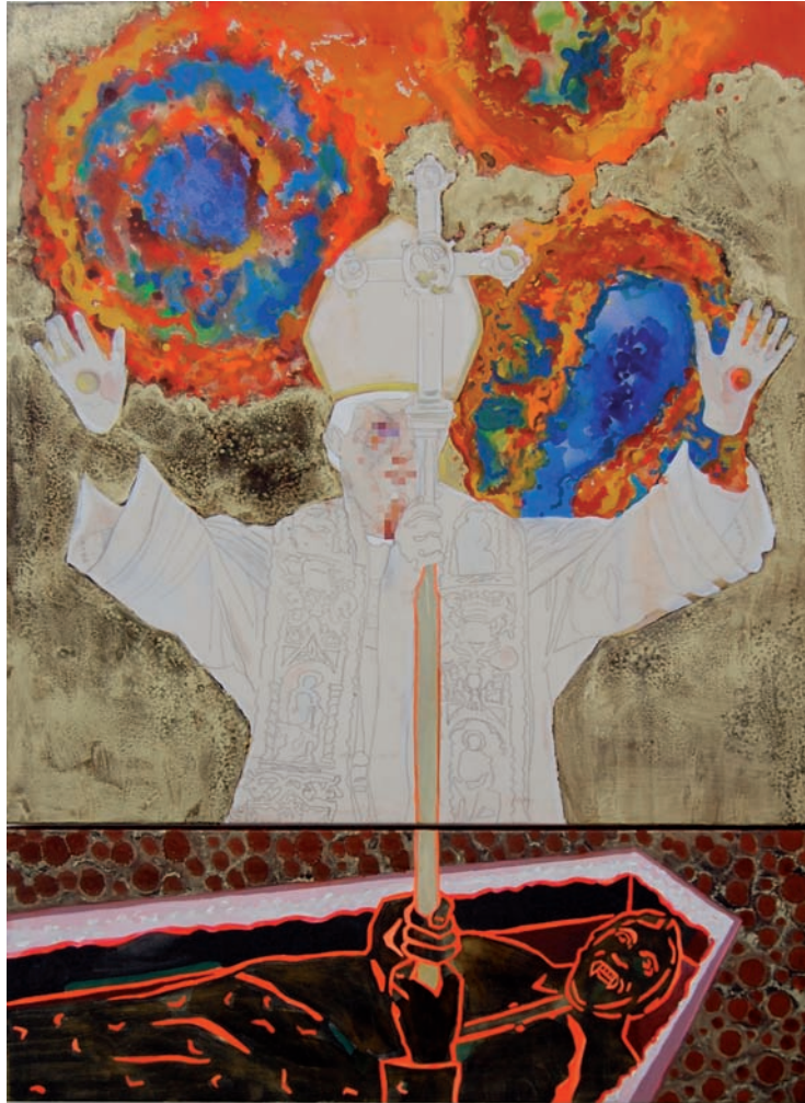
„Vampire in Afrika“ 2009, Öl und Schelllack auf Leinwand 160 x 120 cm