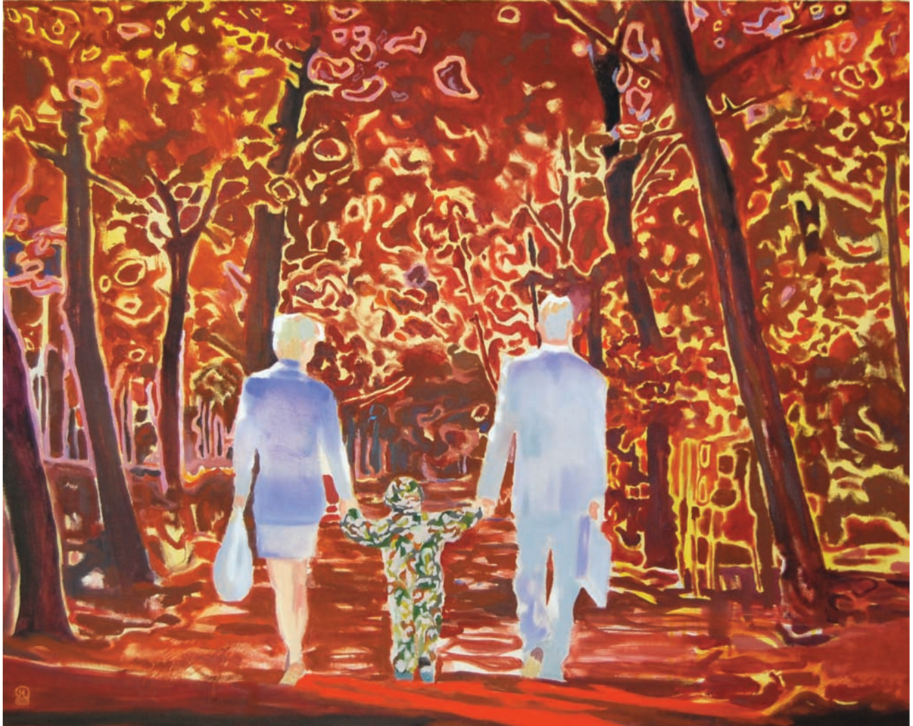
„Camouflage“ 2010, 80 x 100 cm, Öl und Acryl auf Leinwand