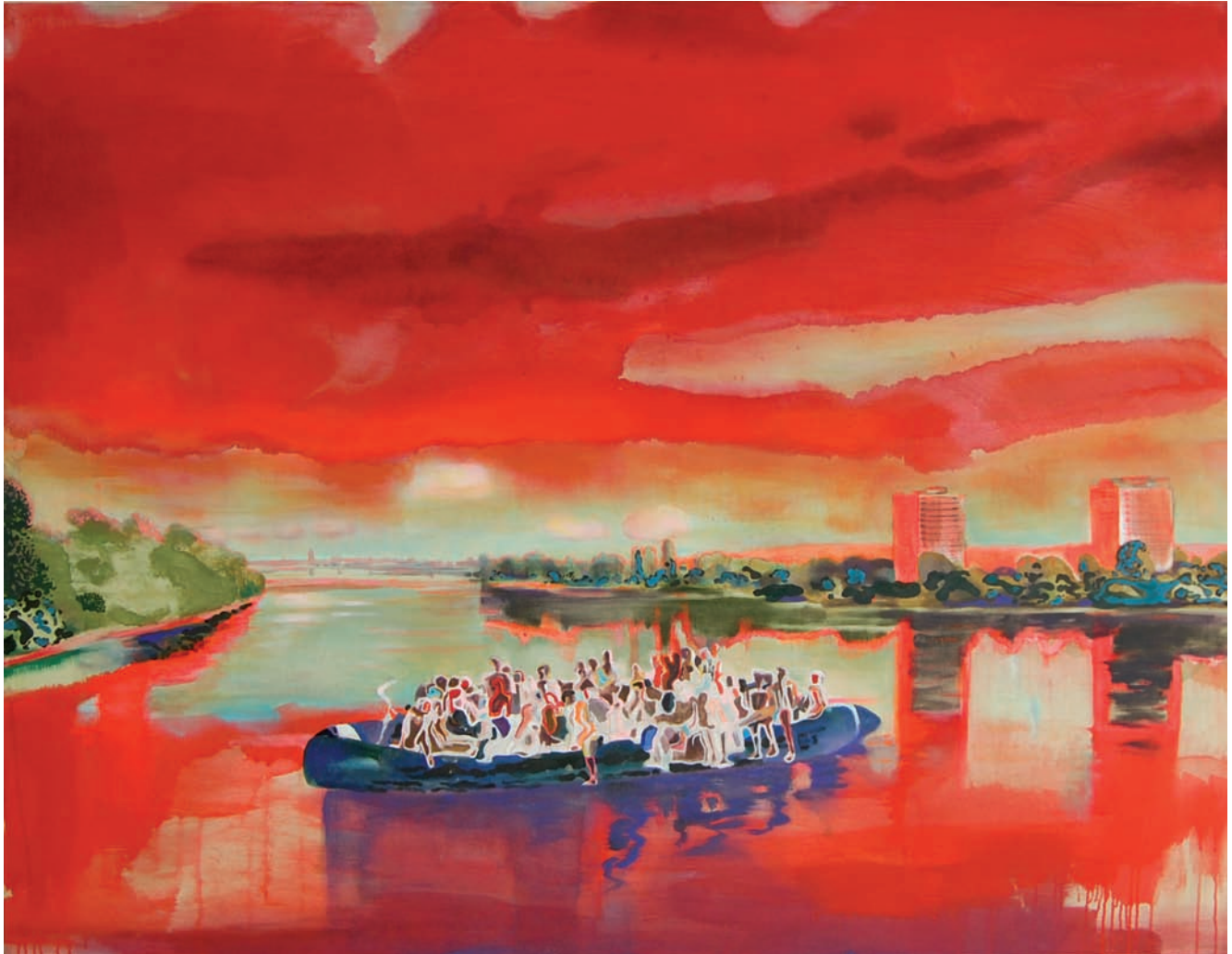
„Auf dem Rhein bei Basel“ 2009, 140 x 180 cm, Öl und Acryl auf Leinwand