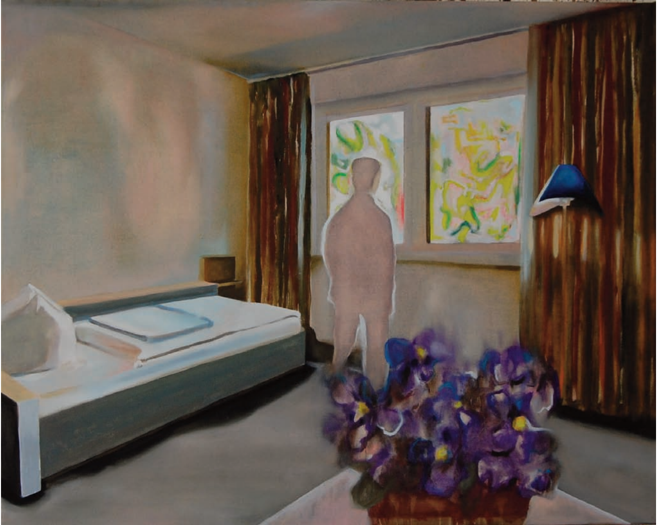
„Das Usambaraveilchen“ 2010, 80 x 100 cm, Öl und Acryl auf Leinwand