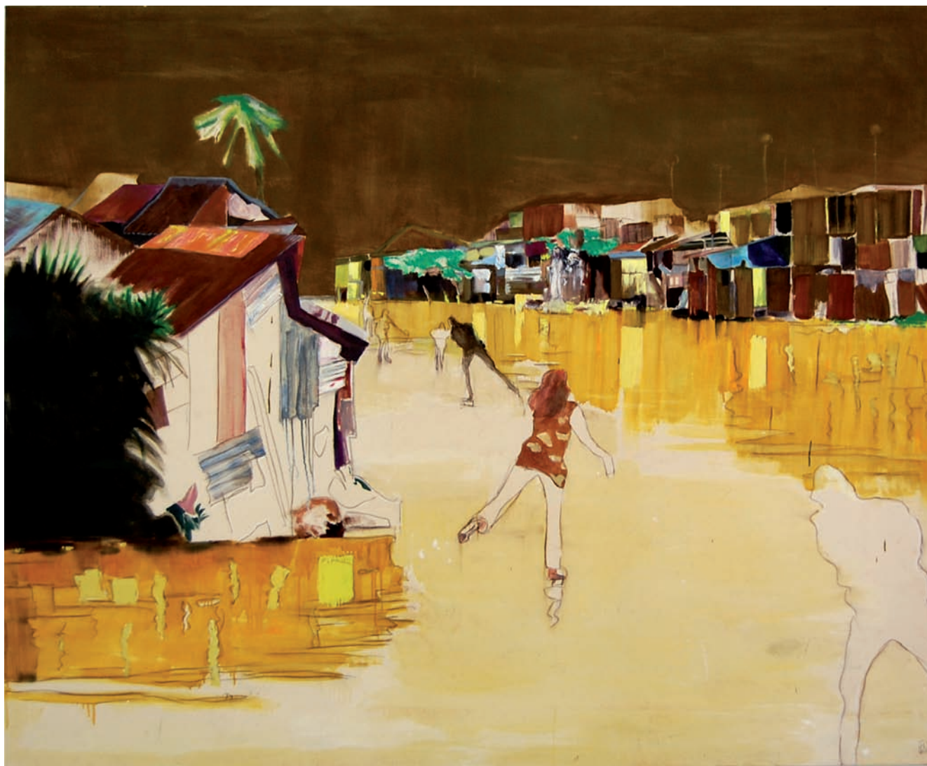
„Die Eisläufer“ 2009, 180 x 220 cm, Öl, Teer und Acryl auf Leinwand