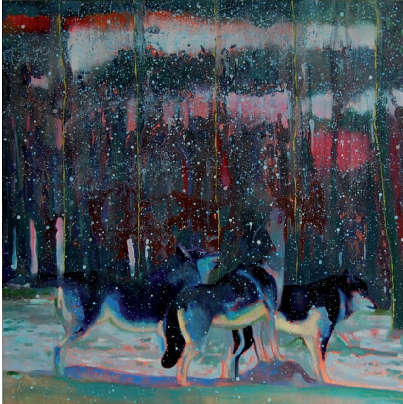
„Wolfshimmel“ 2009 Öl und Acryl auf Leinwand 100 x 100 cm