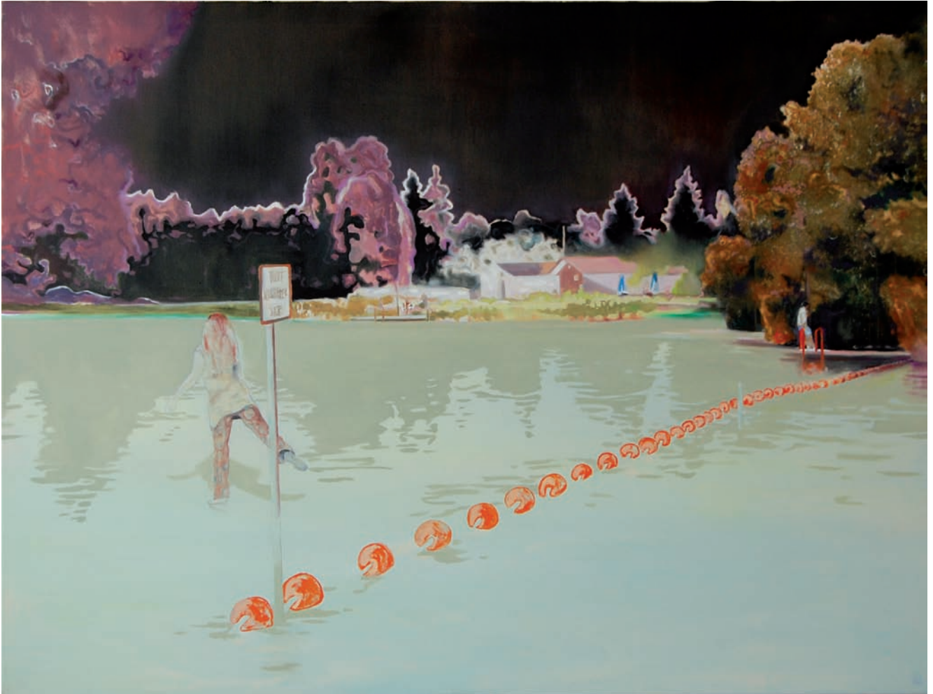
„Die Überschreitung“ 2010, 120 x 160 cm, Öl und Acryl auf Leinwand