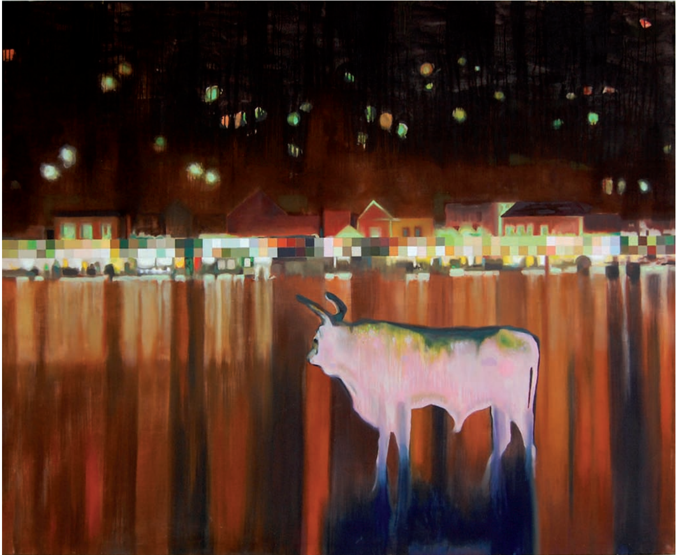
„Die Heimkehr des Odysseus“ 2009, 180 x 220 cm, Öl, Teer und Acryl auf Leinwand