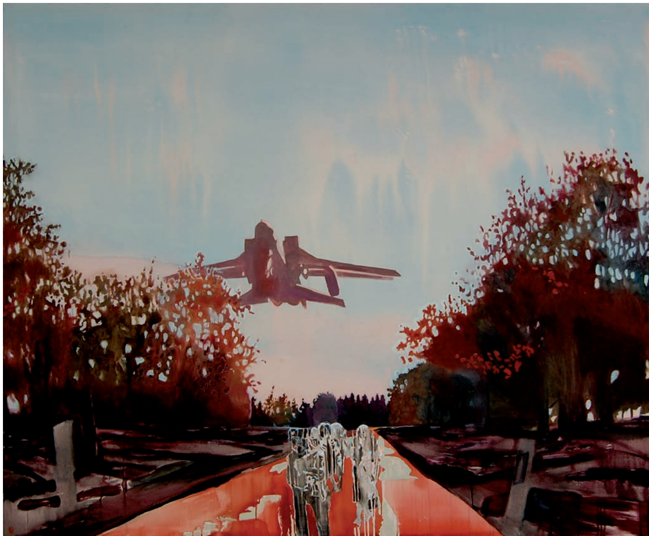
„Der Abendspaziergang“ 2009, 180 x 220 cm, Öl, Teer und Acryl auf Leinwand