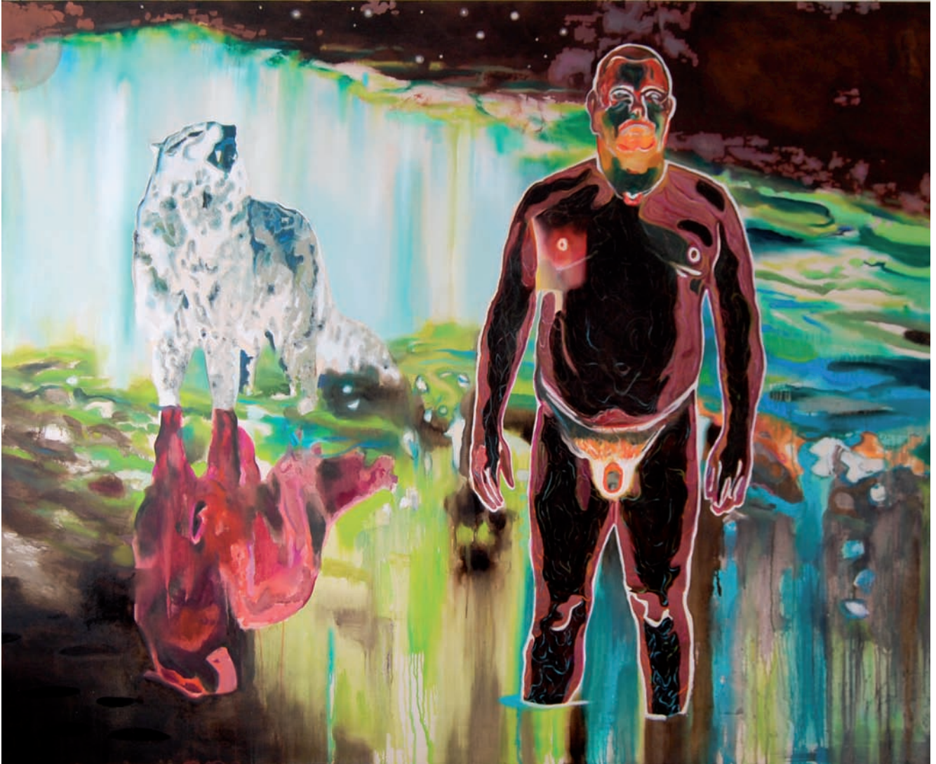
„Das Herz des Wolfs“ 2009/2010, Öl, Teer und Acryl auf Leinwand 180 x 220 cm