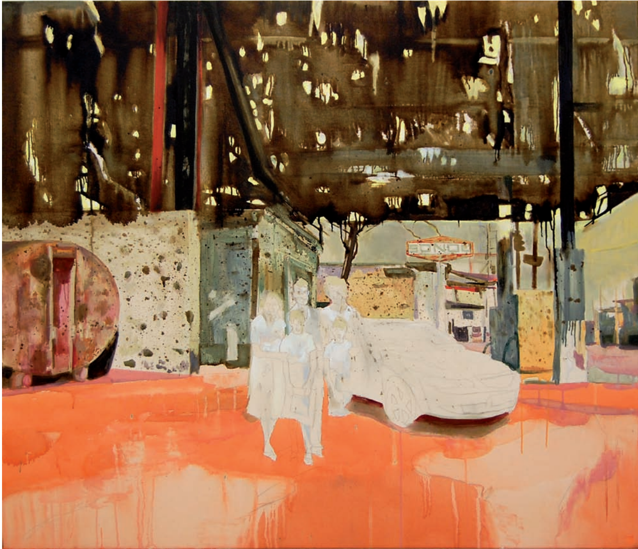
„Der Familienausflug“ 2009, 120 x 140 cm, Öl, Teer und Acryl auf Leinwand