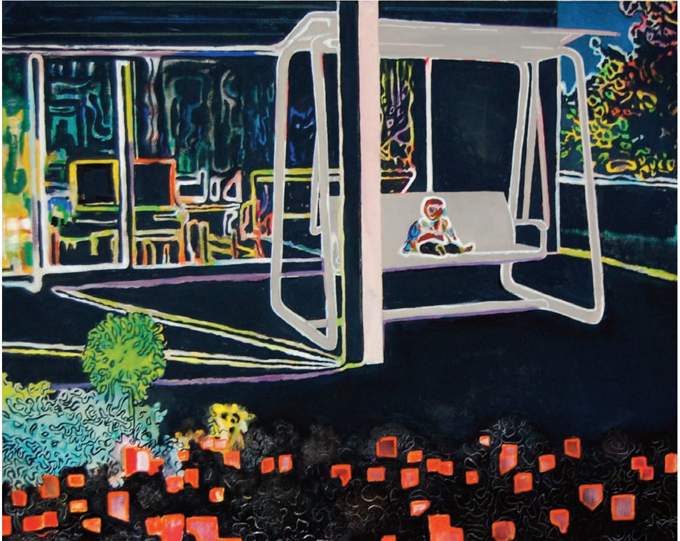
„Hollywoodschaukel 'Mondo'“ 2010, 80 x 100 cm, Öl und Acryl auf Leinwand