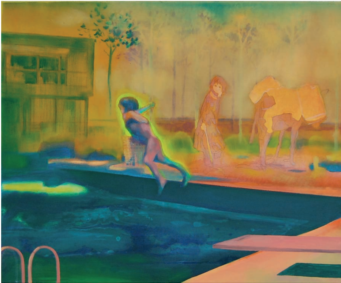
„Zwei am Pool“ 2009, 70 x 85 cm, Öl und Acryl auf Leinwand