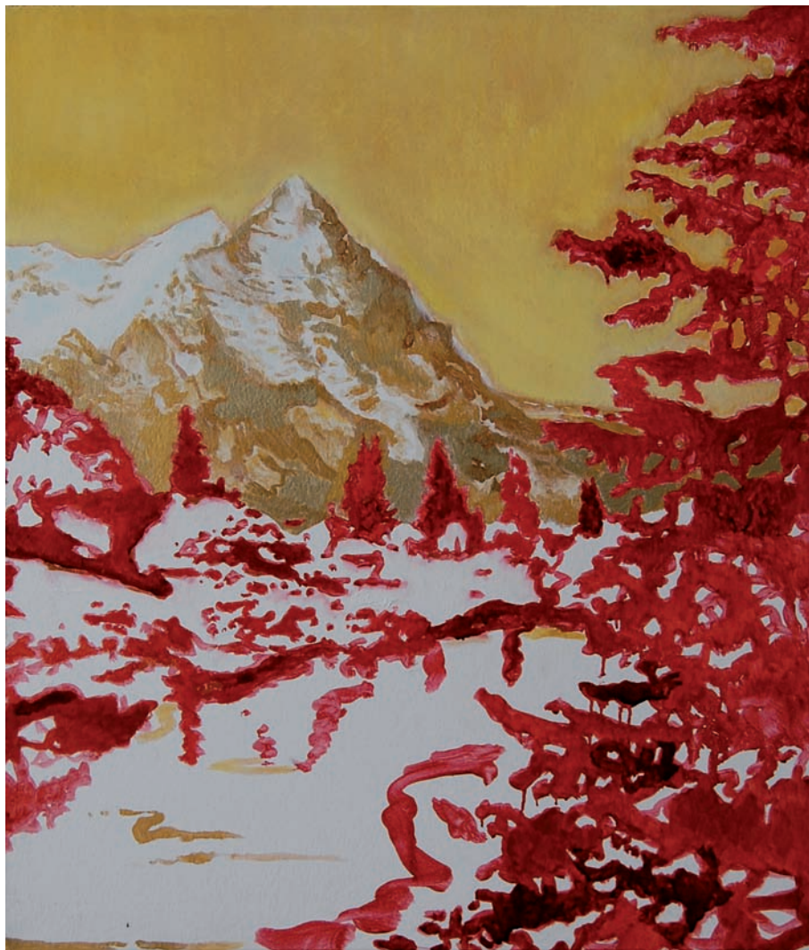
„Das Gold der Schweizer Berge“ 2010, Triptychon, je 70 x 60 cm, Öl, Goldpulver und Acryl auf Leinwand