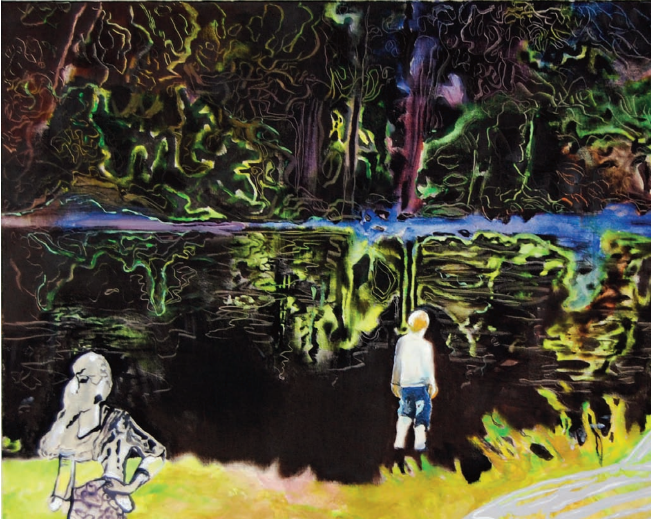
„Der Junge musste unbedingt mal raus“ 2010, 80 x 100 cm, Öl und Acryl auf Leinwand