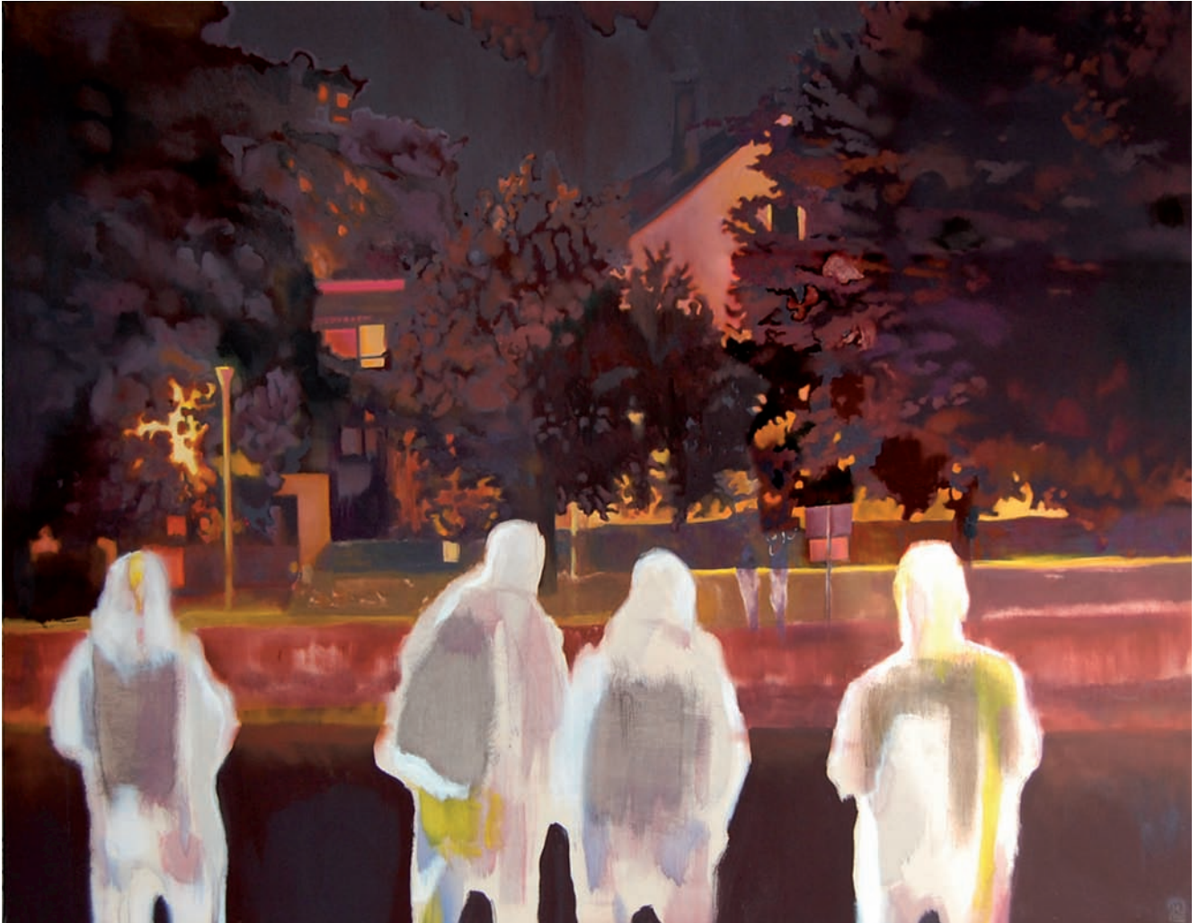
„Die Besucher“ 2009, 140 x 180 cm, Öl und Acryl auf Leinwand