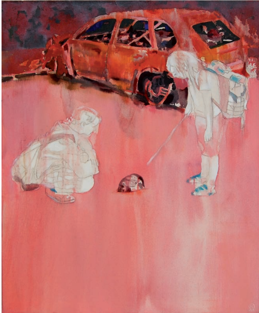
„Der Igel“ 2009, 85 x 70 cm, Öl und Acryl auf Leinwand