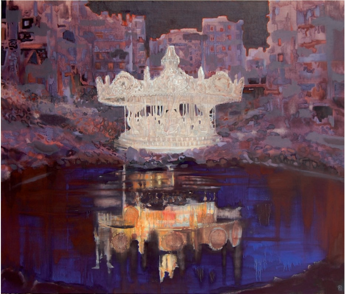
„Das Karussell“ 2009, 120 x 140 cm, Öl, Teer und Acryl auf Leinwand