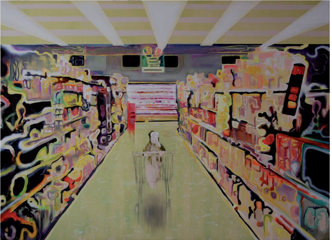
„Milchprodukte“ 2010, 160 x 220 cm, Öl und Acryl auf Leinwand