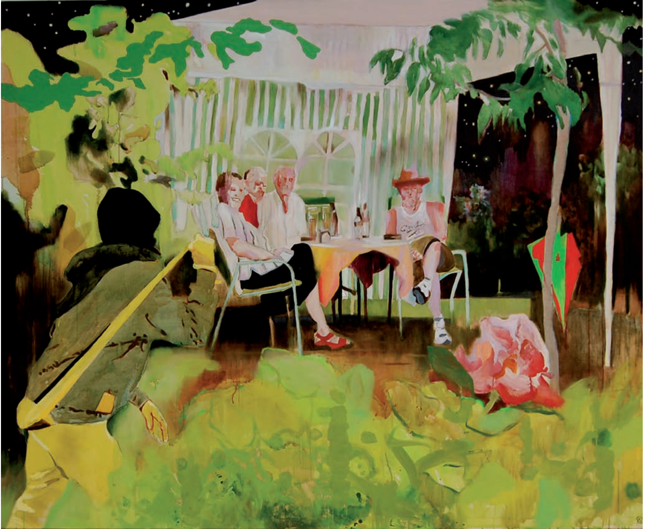
„Der Pavillon“ 2009, 180 x 220 cm, Öl, Teer und Acryl auf Leinwand