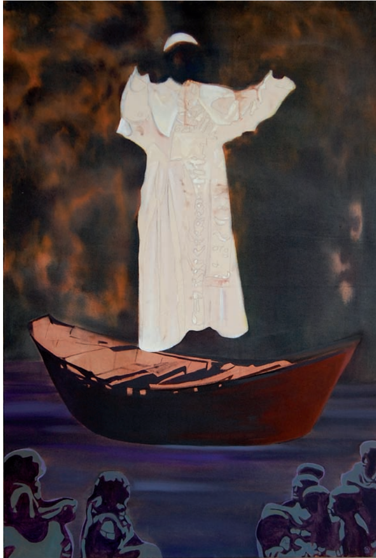
„Der Papst reist übers Meer und segnet afrikanische Aidswaisen“ 2009, 180 x 120 cm, Öl und Acryl auf Leinwand